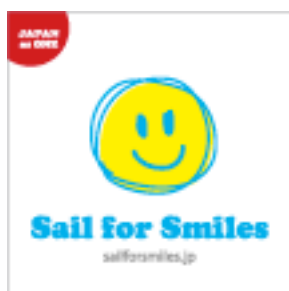
【大会旗】 運営艇に用いる